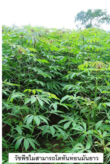
วัชพืชไม่สามารถโตทันท่อนมันยาว