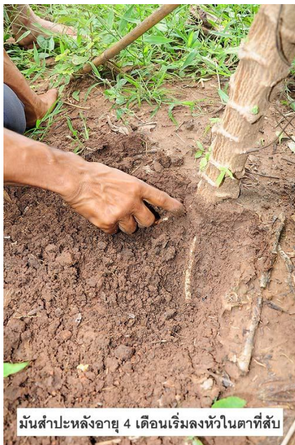
มันสำปะหลังอายุ 4 เดือนเริ่มลงหัวในตาที่สับ

ขั้นตอนการปลูกก็มีรายละเอียดที่น่าสนใจ โดยพันธุ์ที่คุ้นเคยของสุโขทัยคือพันธุ์เกษตรศาสตร์ โดยการปลูกเริ่มจากการไถเตรียมดินแบบทั่วไป แล้วทำการยกร่องเป็นแนวยาวโดยไถเป็นร่องลึกประมาณ 1 ฟุต หรือ 30 เซนติเมตร จากนั้นก็วัดระยะต้น 1 x 1 เมตร ปักไม้เป็นเครื่องหมายไว้ นำปุ๋ยหมักที่ทำเตรียมไว้ใส่ลงไป ในร่องตามจุดที่วัดไว้ อัตรา 0.8 - 1 กิโลกรัมต่อหลุม แล้วทำการกลบดิน จากนั้นก็สามารถนำท่อนพันธุ์ที่ทำการสับตาไว้มาปลูกได้เลยทันที จากนั้นใช้แรงงานคนปัก ท่อนพันธุ์ลงบริเวณที่เราปักไม้และใส่ปุ๋ยไว้ โดยการปักต้องปักให้ตั้งตรงโดยไม่ต้องเอียง เพราะถ้าปักเอียงเหมือนเกษตรกรรายอื่นจะทำให้หัวมันออกไม่รอบกิ่งพันธุ์ ในส่วนของการใส่ปุ๋ยเคมีจะไม่มี การใส่อีกแล้วเพราะใส่ปุ๋ยหมักรองก้นหลุมครั้งเดียวก็เพียงพอแล้ว วัชพืชก็ไม่ต้องกำจัดเพราะการที่เราใช้ท่อนพันธุ์ที่มีขนาดยาวทำให้เวลาปลูกสูงและวัชพืชโตไม่ทันมันที่เราปลูกถ้ามีเพลี้ยแป้งหรือแมลงชนิดอื่นๆระบาดก็ทำการฉีดพ่นด้วยน้ำส้มควันไม้ หรือน้ำหมักชีวภาพ