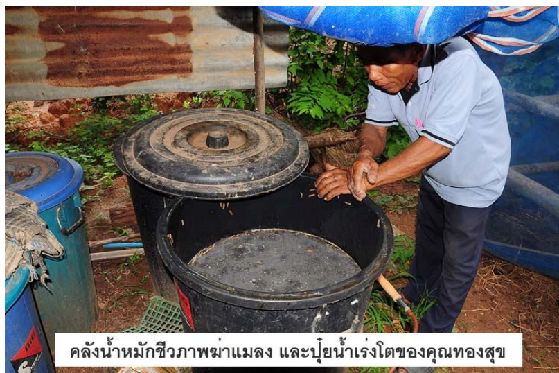
คลั่งน้ำหมักชีวภาพมาแมลง และปุ๋ยน้ำเร่งโตของคุณทองสุข

3. หาววัสดุมาคลุมกองปุ๋ยไว้เช่น กระสอบปุ๋ย ทางมะพร้าว หรือผ้าพลาสติก ระหว่างกระบวนการหมักจะเกิดความร้อน ควรกลับกองปุ๋ยหมักทุกๆ 10 วัน และสังเกตดูเสมอว่าความชื้นในกองเพียงพอโดยใช้มือจับดู ถ้ายังชื้นเมื่อบีบแล้วจะรู้สึกว่ายังชื้นวัสดุยังจับตัวกัน แต่ถ้าความชื้นไม่พอควรรดน้ำลงไปแต่อย่าให้แฉะ กระบวนการหมักจะใช้เวลาประมาณ 30 – 45 วัน ก็สามารถนำไปใช้ได้