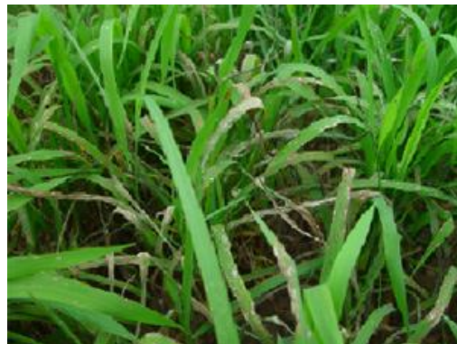
อาการใบไหม้คล้ายน้ำร้อนลวก