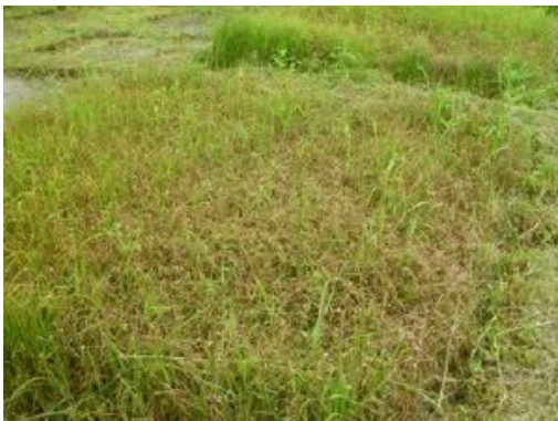
แปลงกล้าที่โรคไหม้ระบาด

“ฟ้าหลังฝนย่อมสดใสเสมอ” จากสถานการณ์อุทกภัยที่ผ่านมาเมื่อปลายปี 2554 จนมาถึงขณะนี้เข้าสู่สภาวะปกติเรียบร้อยแล้ว พี่น้องชาวนาเริ่มฤดูกาลแห่งความหวัง แต่ก็ต้องมาประสบผลพวงที่ตามหลอกหลอนหลังน้ำลด คือเมื่อกล้าที่เพาะไว้กำลังเริ่มงอกงามแต่กลับเกิดอาการใบไหม้แห้งตายเสียหายจำนวนมาก อย่าเพิ่งสิ้นหวังหมดกำลังใจตั้งแต่เริ่มนะครับ วิธีการป้องกัน และแก้ไขยังคงมีอยู่เสมอ และผมจะนำมาเสนอให้ทุกท่านทราบกันในฉบับนี้