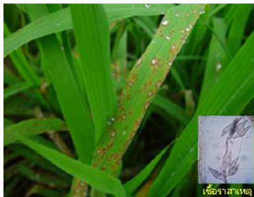
อาการใบจุดข้ำน้ำและรูปตา